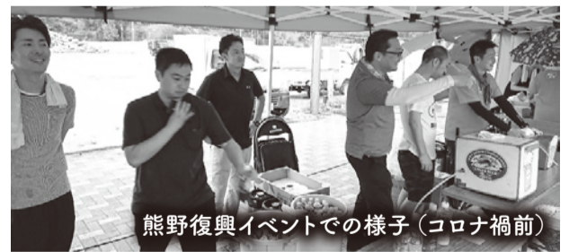
熊野復興イベントでの様子(コロナ禍前)