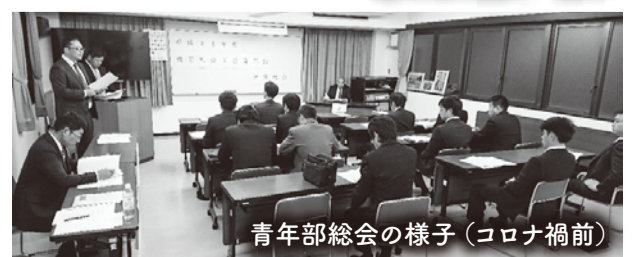
青年部総会の様子(コロナ禍前)