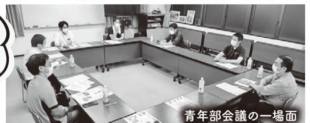
青年部会議の一場面