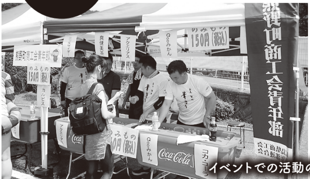
イベントでの活動の様子(コロナ禍前)