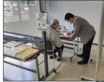
<相談ブースの様子>