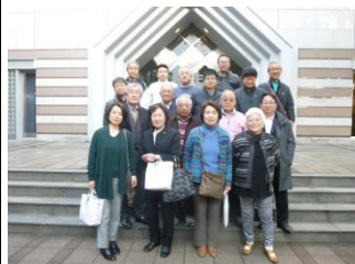
神戸 コーヒー博物館

2月5日(火)～2月6日(水)、商業部会、筆部会、建設工業部会、三部会合同で県外研修を行いました。